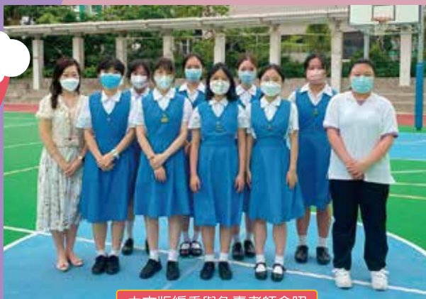
中文版編委與負責老師合照