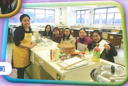
家長學堂 - 烹飪示範