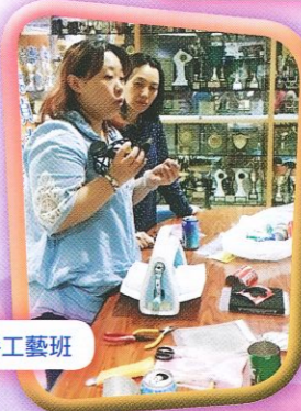
家長學堂 - 環保手工藝班