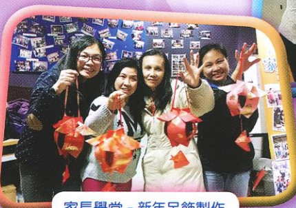
家長學堂 - 新年吊飾製作