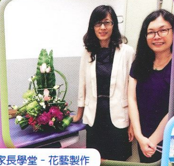
家長學堂 - 花藝製作