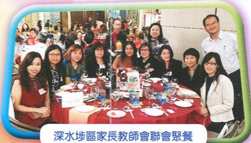
深水埗區家長教師會聯會聚餐