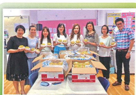
開學禮儀及敬師日活動