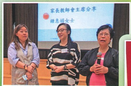
中一迎新日家長講座