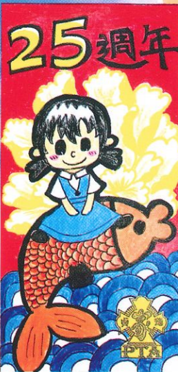
25週年利是封設計比賽 冠軍作品 - 朱殿樂同學