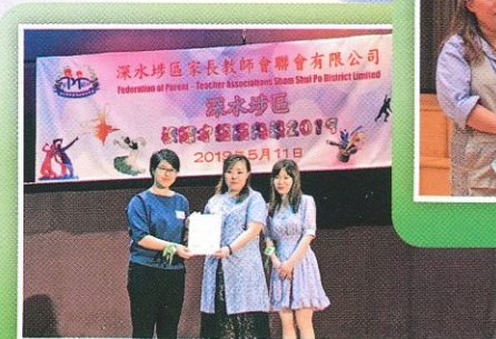
深聯會傑出家長教師會頒獎典禮