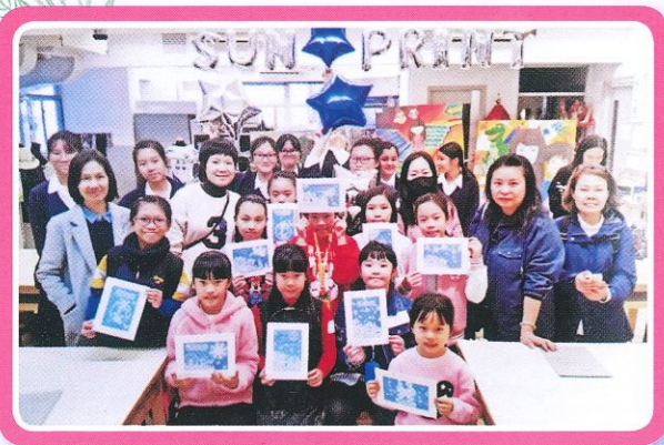
深水埗區家長教師會聯會有限公司舉辦 深水埗區校際才藝展光華 2019

很高興今年能成為家長教師會委員的一份子。今年非常特別，因疫情關係，學校需要停課，連活動也被迫取消及減少。雖然學習模式改變了，但老師對學生的關心有增無減，經常與家長緊密聯繫，了解學生的學習情況。而我們一班家長亦常常互相問候及提點大家，希望盡快回復正常生活，到時大家可以在學校見面！