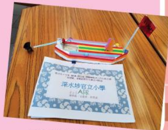
電動模型船比賽作品二