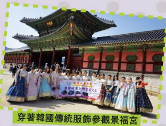
穿著韓國傳統服飾參觀景福宮