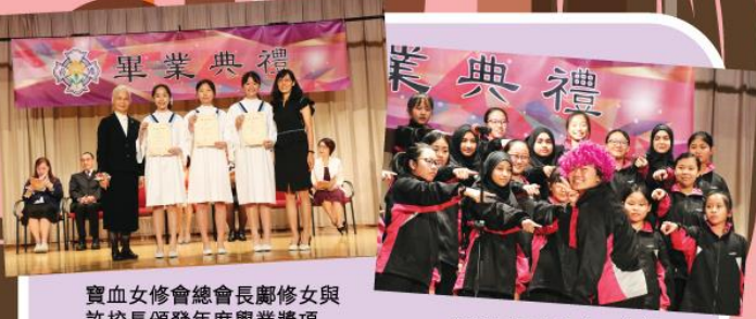
寶血女修會總會長鄺修女與許校長頒發年度學業獎項