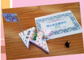
電動模型船比賽作品一