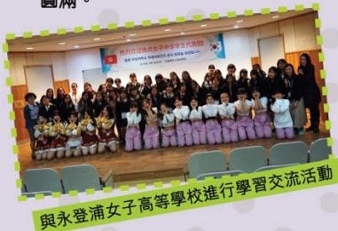
與永登浦女子高等學校進行學習交流活動

隨後，學生亦考察了南山韓屋村、到東琳繩結博物館進行傳統韓國特色手繩製作、參觀仁寺洞耕仁美術館和新堂創意空間、穿著韓國傳統服飾參觀景福宮、欣賞塗鴉 Show「The Painter」及到南山首爾塔欣賞櫻花等等學習活動，首爾的傳統建築和文化令是次的旅程更告圓滿。