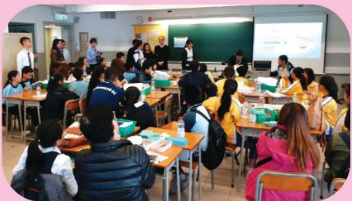
小學生積極投入比賽

由本校舉辦的「電動模型船比賽」設有兩個大獎，包括「外型設計獎」和「最高航速獎」。為奪取獎項，各友校小學參賽代表同學均全力以赴，利用不同工具，並根據老師的建議拼砌出多艘美輪美奐的模型船。