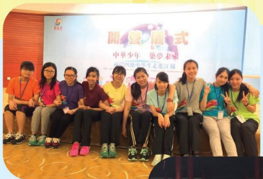
兩岸四地中學生走進江蘇