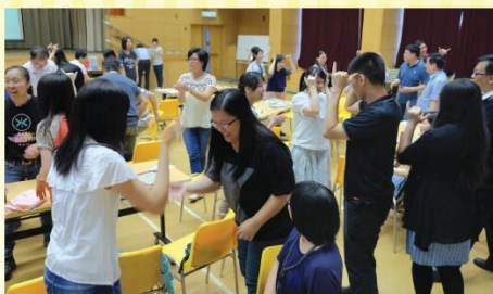
剪刀、石頭、布——老師也從遊戲中學習

本學年第一次教師專業發展日於8月26日在本校禮堂舉行。為配合學校目標「開展生命教育」，是次發展日題目為「台灣生命教育學習團分享會」。參與台灣生命教育學習團的老師，除介紹台灣生命教育現況及學校特色外，更就本校概況作分析。發展日結束，學校將配合學生成長的需要，擬定工作計劃，開展校本生命教育課程。