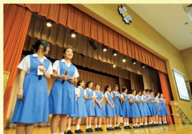
全體學生以歌唱《良師頌》向老師致敬