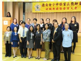
新一屆家長教師會幹事合照