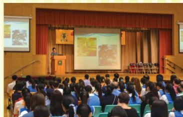
中三級選科輔導家長座談會

座談會後隨即舉行第二十二屆家長教師會幹事選舉暨就職典禮，會員選出了家長執委、家長校董及替代家長校董。期望新一屆幹事能共同發揮「家校同心，共創美好校園」的精神。