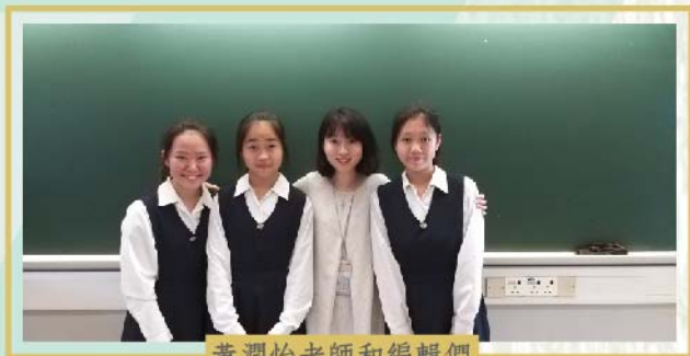
黃潤怡老師和編輯們