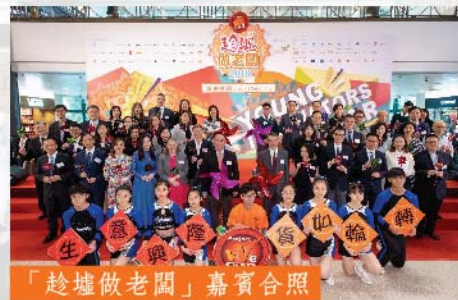
「趁墟做老闆」嘉賓合照