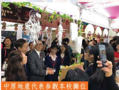
中原地產代表參觀本校攤位