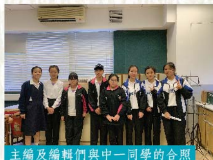
主編及編輯們與中一同學的合照

談到學校到教學方式，师妹們都表示很喜歡現在的教學方式，但同時希望老師可以多幫助一些在學習上有困難的學生。面對學習上的壓力，师妹們都會與自己的朋友聊天、聽音樂、填顏色、甚至會玩一些比較刺激的遊戲如過山車，以減輕學習的壓力，藉此放鬆心情。