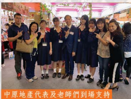
中原地產代表及老師們到場支持